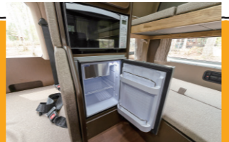
冷蔵庫と電子レンジ